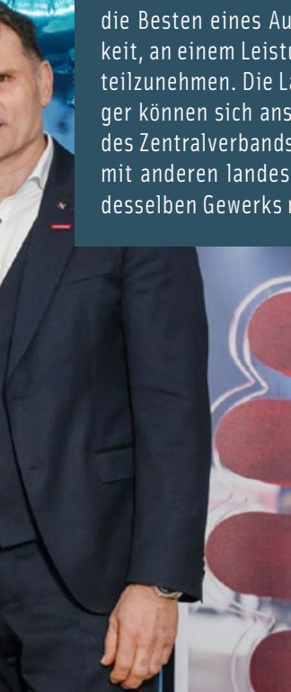
DMH-Feier in der Handwerkskammer

Bei den Deutschen Meisterschaften im Handwerk haben die Besten eines Ausbildungsjahrgangs die Möglichkeit, an einem Leistungswettbewerb auf Landesebene teilzunehmen. Die Landessiegerinnen und Landessieger können sich anschließend beim Bundesentscheid des Zentralverbands des Deutschen Handwerks (ZDH) mit anderen landesbesten Gesellinnen und Gesellen desselben Gewerks messen.