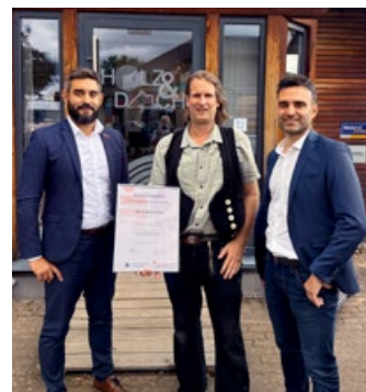
Urkundenverleihung an die Holz & Dach Leyherr GmbH, Dillingen.

wie wichtig eine gute Betriebskultur für Motivation, Nachwuchsgewinnung und langfristigen Erfolg ist.