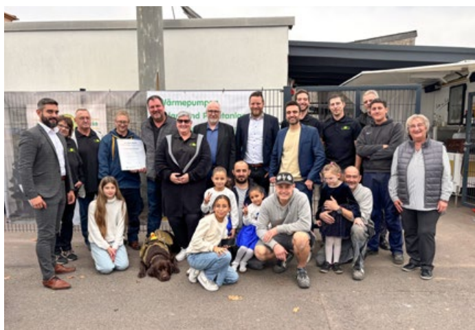
Bei der Firma KSZ Heizung und Sanitär GmbH, Völklingen.

TEAMGEIST, WERTSCHÄTZUNG UND ECHTES MITEINANDER: VIER SAARLÄNDISCHE HANDWERKSBEREICHE WURDEN ALS »TOP-ARBEITGEBER IM SAAR-HANDWERK« AUSGEZEICHNET.