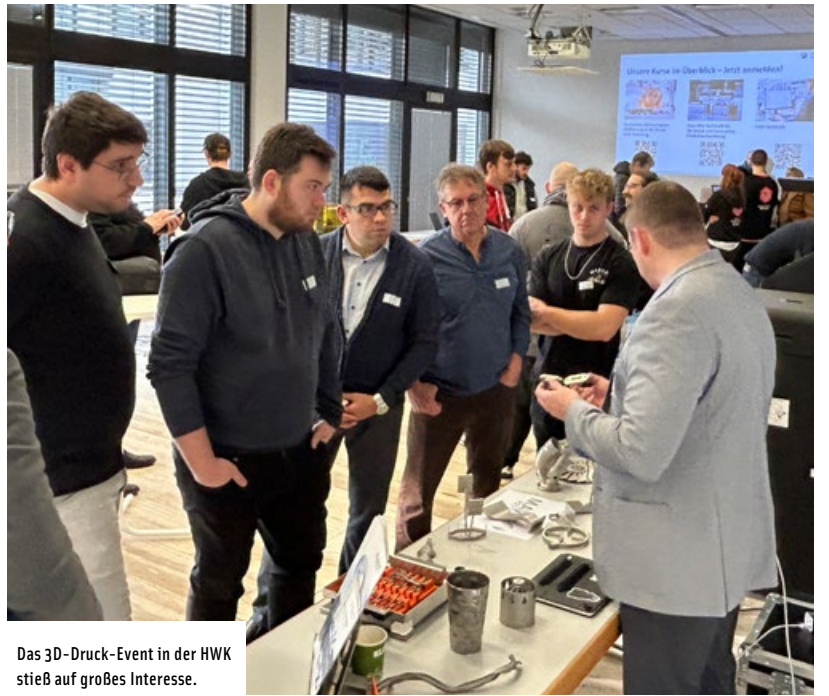
Das 3D-Druck-Event in der HWK stieß auf großes Interesse.