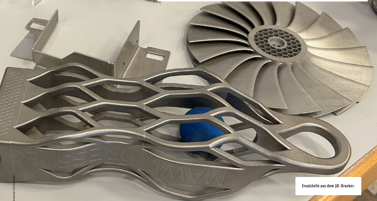
Ersatzteile aus dem 3D-Drucker.