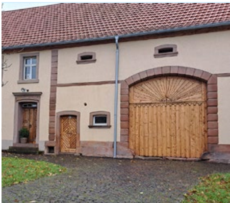
Erster Platz im Saarländischen Bauernhauswettbewerb 2025