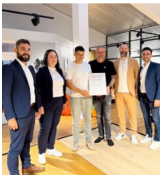
Urkundenverleihung bei der Bodenbau Wolfgang Schmidt GmbH, Beckingen.

Mit dem Wettbewerb setzen HWK und Sparkassen-Finanzgruppe ein Zeichen für Wertschätzung im Handwerk und machen sichtbar,