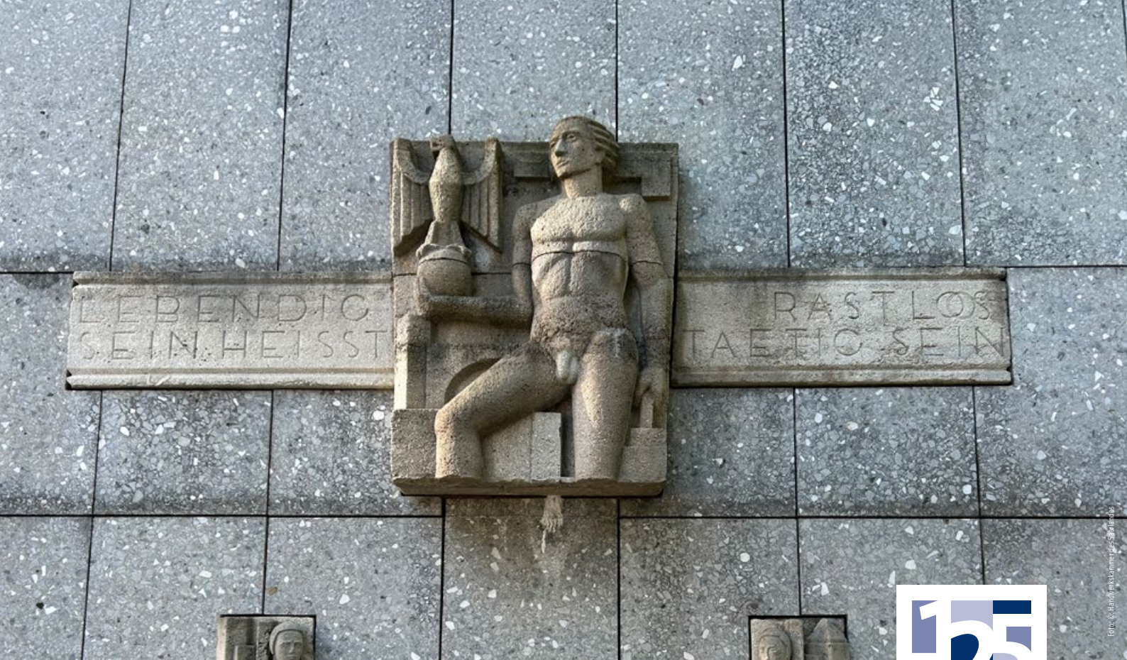
Diese Skulptur befand sich ursprünglich über dem Eingang des alten Kammergebäudes aus dem Jahr 1929 und ist in der Fassade des heutigen Verwaltungssitzes integriert.