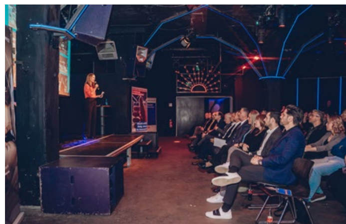
Kreativer Raum für kreative Köpfe: Die DMH-Feier fand im außergewöhnlichen Ambiente des Sektor Heimat in Saarbrücken statt.

Weitere Sponsoren der Veranstaltung waren die Bank1Saar sowie die Signal Iduna.